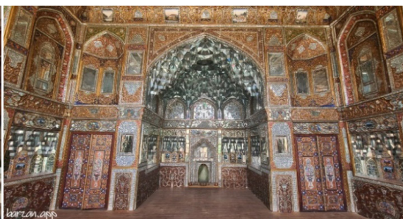
عکس ۱. تالار آینه