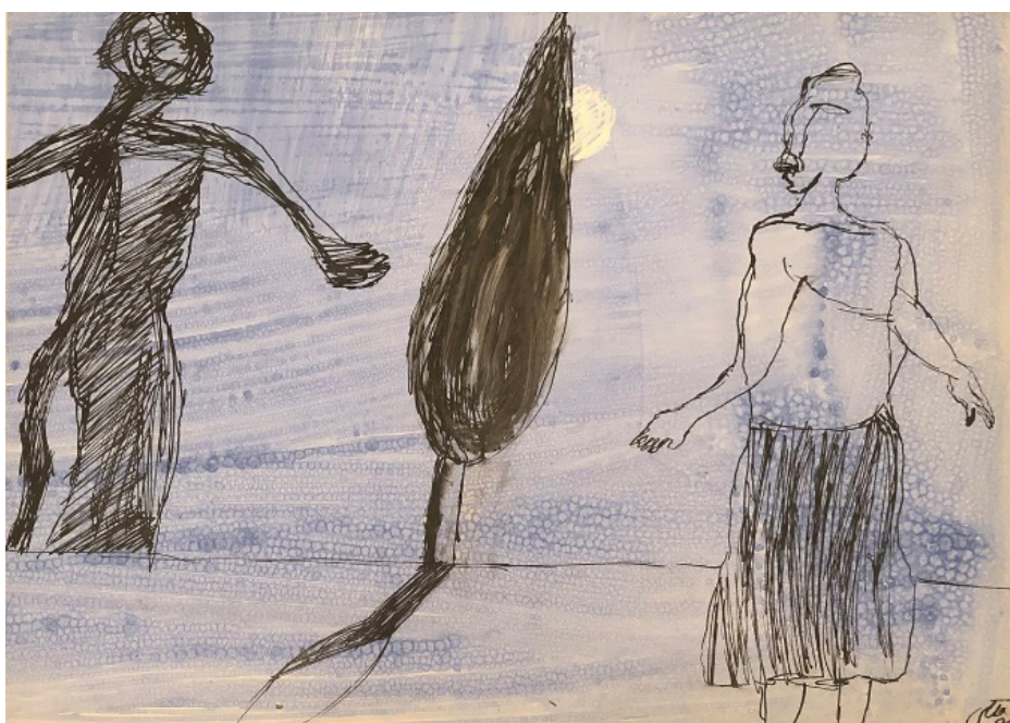
تصاویر ۱. نمونه‌های کاربردی (URL 1)

«چشم»، عنصر مهم دیگری در آثار ملکی است. چشم‌ها در چهره یا توخالی هستند، یا با درد به مخاطب می‌نگرند یا چهره هیچ جزئیاتی ندارد. اضطراب و خجالت خود را در چهره به رخ می‌کشد. رنگ‌ها در آثار او متنوع هستند، گویی ملکی به دنبال تجربه کردن طیف‌های گوناگون رنگ در نقاشی‌های خود است. او به دنبال رنگ آمیزی مرتب و صحیح در آثار نیست، بلکه به مثابه خط خطی کردن و با نوعی بی دقتی نمایش داده می‌شود. «شیوه اجرایی او مثل خط خطی‌های حاشیه دفترچه تلفن است که با ذهن خالی و دستی خودمختار روی صفحه جاری شده‌اند» (خضری، ۱۳۹۷: ۱۴۴). در نقاشی‌های ملکی با تعدد و تجمیع انسان، نوعی ریتم وجود دارد. چشم بیننده در میان انسان‌ها سرگردان است، درست مانند «خطوط» مورد استفاده در نقاشی‌های او «هرکدام ریتم‌هایی را توزیع می‌کنند، درحالی‌که فیگورهای زیادی در