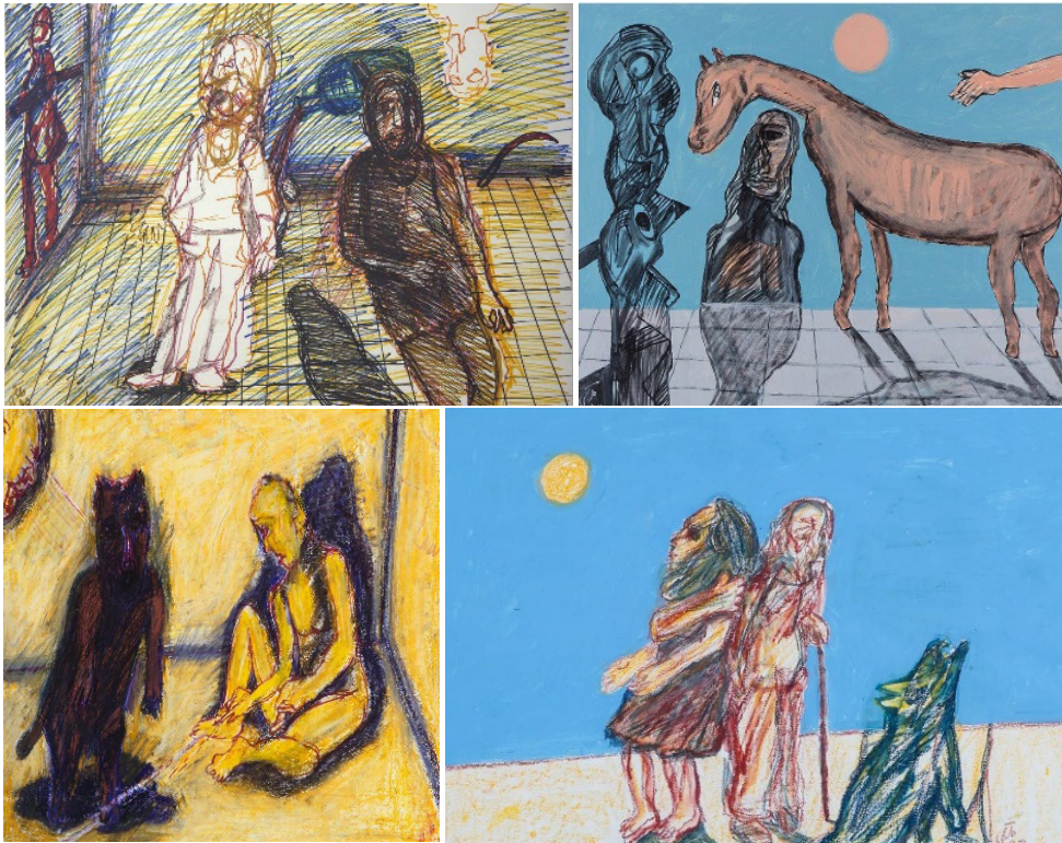
تصاویر ۴. نمونه‌های کاربردی (URI 1)