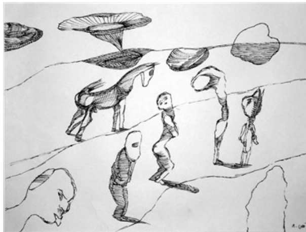
تصاویر ۲. نمونه‌های کاربردی (URL 1)