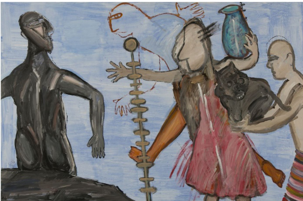
تصاویر ۳. نمونه‌های کاربردی (URL 1)

همان‌طور که دلوز بیان می‌کند، خط از میانه نقاط عبور می‌کند و هیچ چیزی به صورت مستقیم در آثار ملکی دیده نمی‌شود. «آشوب» و «فاجعه» در آثار پدیدار است و از همه مهم‌تر انفعال و اضطراب آدمی در عصر مدرن به خوبی در حرکت چشم، دست و صورت خود را نشان می‌دهد. در آثاری که ملکی چهره را نمایش نمی‌دهد نیز رنگ و خطوط نماینده نمایش این اضطراب به مخاطب هستند.