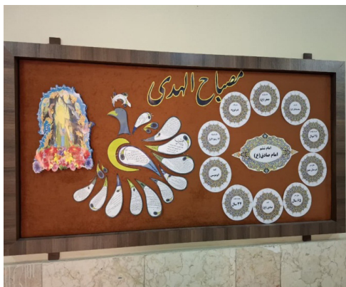
تصویر ۷. تابلو اعلان پرورشی مدرسه پژوهشگران، (۱۴۰۳).

از میان آنها فقط یک نفر مدرک تخصصی هنر دارد و بقیه صرفاً برای پر کردن ساعت آموزشی خود به عنوان دبیر هنرکار می‌کنند! وی دارای مدرک لیسانس در رشته هنرهای تجسمی است و در مجموع ۱۹ سال سابقه تدریس هنر دارد. در هر ۴ کلاس پایه نهم دانش‌آموزان اغلب فعالیت‌های یکسانی نظیر (نقاشی، سیاه‌قلم، ساخت پوستر، حجم اجسام، خوشنویسی و...) را انجام می‌دهند و طبق سرفصل‌های کتاب پیش می‌روند. وقتی از دبیر مربوطه هنر می‌پرسم که آیا در مدرسه جایی هست که در آن بتوان آثار و فعالیت‌های هنری دانش‌آموزان را به نمایش گذاشت؟ او با حالتی حاکی از نارضایتی و ناراحتی به من پاسخ می‌دهد که "نه مدرسه یک ویترین دارد که آن هم برای آثار درس کار و فناوری است. هنر جا و مکانی ندارد و به همین علت آثار هنری دانش‌آموزان در خانه نزد من نگهداری می‌شود! البته باید بگویم که من امسال به این مدرسه منتقل شده‌ام، ولی شنیده‌ام که قبلاً درس هنر یک تابلوی اعلان داشته؛ ولی در حال حاضر معاون پرورشی مدرسه از آن استفاده می‌کند. راستش را بخواهید وضعیت درس هنر در مدرسه چندان خوب نیست. چون این تصور وجود دارد که هنر نقشی در عملکرد تحصیلی بچه‌ها ندارد و می‌شود بدون هنر هم دانش‌آموز خوبی و موفقی بود؛ لذا امکاناتش را به دروس دیگر می‌دهند." به همین دلیل است که در ویترین، آثار دانش‌آموزان شامل کار با فلزات (قوطی رانی)، بافت، کار با چوب و... که مربوط به درس کار و فن آوری است، نمایش داده شده است. حال آنکه وضعیت به گونه‌ای است که آثار هنری و خلاقانه دانش‌آموزان در خانه دبیر آن نگهداری می‌شود! تصاویر زیر دو نمونه از تابلوی اعلانات مدرسه است که از کاردستی به عنوان ابزاری برای جذابیت موضوع خود استفاده کردند.