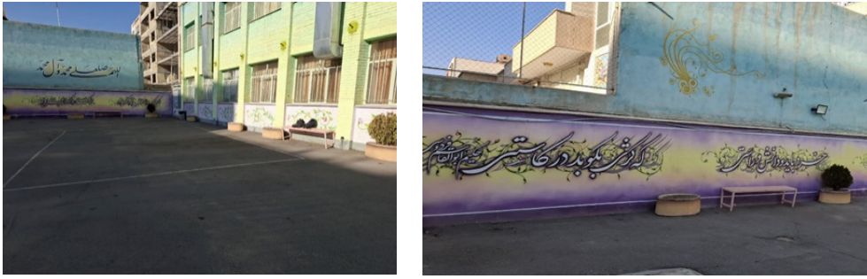
تصویر ۲. اشعار روی دیوار حیاط مدرسه (پژوهشگران، ۱۴۰۳).

همچنین، مدرسه دارای فضایی باز و مناسب برای تفریح و ورزش دانش‌آموزان است. هنگام ورود به مدرسه در سمت راست یک آب‌نمای سنگی قو ساخته شده و دانش‌آموزان می‌توانند برای استراحت کنار آن بنشینند. کمی جلوتر بوفه مدرسه قرار دارد و بر دیوارهای آن نقاشی یک حوض با ماهی‌های قرمز کشیده شده است. مساحت محیط ورزشی و سرباز مدرسه به میزان ۳۹۷ متر مربع است که به نظر مناسب می‌آید.