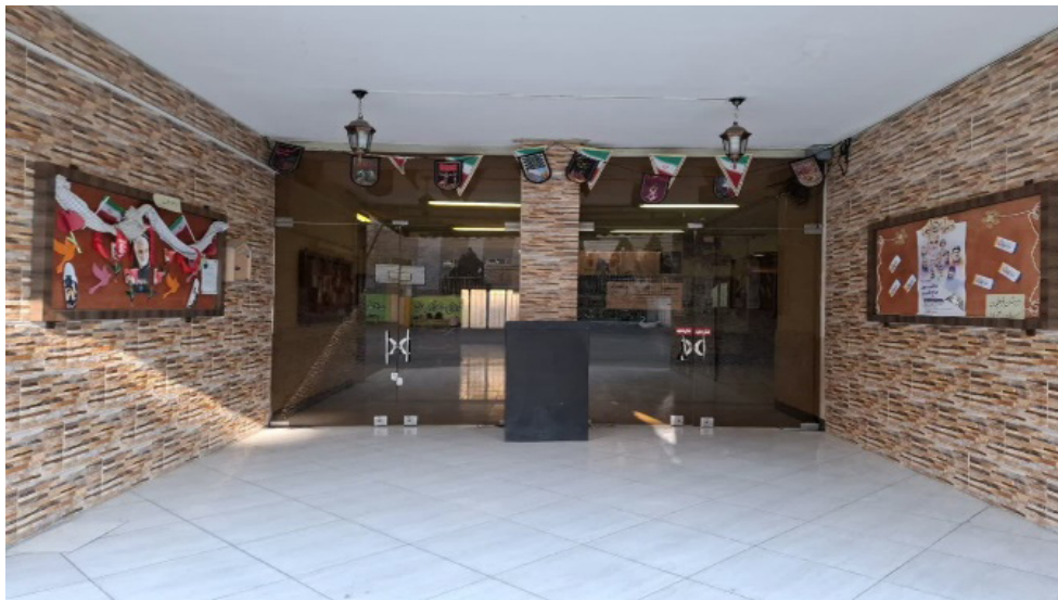
تصویر ۵. راهرو ورودی مدرسه (پژوهشگران، ۱۴۰۳).

در طبقه اول راهرو، دفتر مدیر، اتاق استراحت دبیران، سایت کامپیوتر، آزمایشگاه و در سمت چپ راهرو اتاق معاون پرورشی، ویتترین آثار و فعالیت دانش‌آموزان و کمد شخصی برای دبیران مدرسه ایجاد شده است. مدرسه دارای ۱۳ کلاس آموزشی شامل است که به طور متوسط در هر کلاس ۳۰ نفر دانش‌آموز حضور دارند.