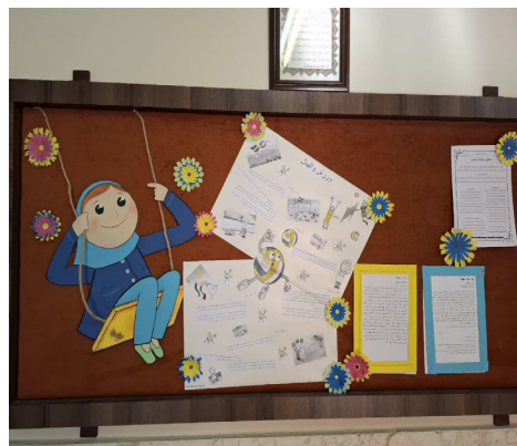
تصویر ۶. تابلو اعلان ورزش مدرسه پژوهشگران، (۱۴۰۳).

تصمیم می‌گیرم برای به دست آوردن تصویری مستندتر از واقعیات و جایگاه درس هنر در مدرسه با مدیر مدرسه هم گفتگویی داشته باشم. او اما درخواست مصاحبه را پذیرفته و پیشنهاد کرد که من اگر با دبیر مربوطه هنر صحبت کنم، بهتر است!