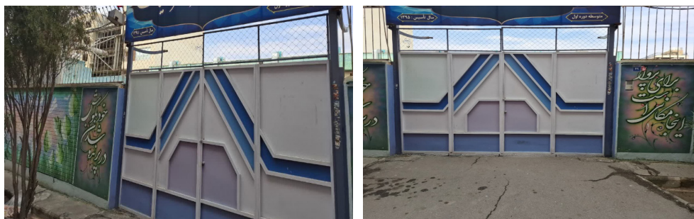
تصویر ۱. درب ورودی مدرسه (پژوهشگران، ۱۴۰۳).

دبیرستان مورد تحقیق در سال ۱۳۹۱ توسط جمعی از خیرین مدرسه ساز با تلاش پنج ساله عوامل مختلف اجرایی تأسیس شد. در سال ۱۳۹۵ در پی تصویب قانون مربوط به شکل‌گیری ساختار نظام آموزشی جدید (۳-۳-۶) این مدرسه به دوره اول متوسطه دخترانه اختصاص یافت. مساحت بنای آموزشی این مدرسه دخترانه ۴۵۸ متر مربع و دارای بیش از ۴۰۰ دانش آموز است.