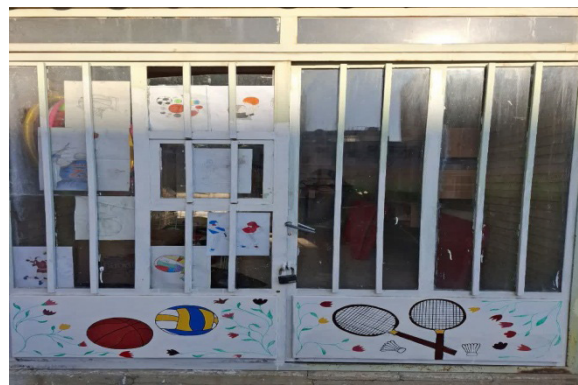
تصویر ۴. اتاق ورزش (پژوهشگران، ۱۴۰۳).

در سمت چپ حیاط مدرسه اتاق ورزش قرار دارد که باز هم در این قسمت دانش‌آموزان با کشیدن نقاشی باسلیقه خود به تزئین آن پرداخته‌اند. ساختمان مدرسه شامل دو طبقه است.