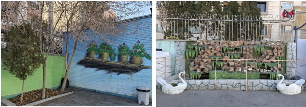
تصویر ۳. آب‌نمای سنگی قو و نقاشی‌های روی دیوار مدرسه (پژوهشگران، ۱۴۰۳).

همچنین، مدرسه دارای فضایی باز و مناسب برای تفریح و ورزش دانش‌آموزان است. هنگام ورود به مدرسه در سمت راست یک آب‌نمای سنگی قو ساخته شده و دانش‌آموزان می‌توانند برای استراحت کنار آن بنشینند. کمی جلوتر بوفه مدرسه قرار دارد و بر دیوارهای آن نقاشی یک حوض با ماهی‌های قرمز کشیده شده است. مساحت محیط ورزشی و سرباز مدرسه به میزان ۳۹۷ متر مربع است که به نظر مناسب می‌آید.