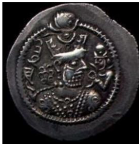
تصویر ۱۷. سکه جاماسب با نقش هلال، (شاهد، ۱۳۸۹: ۸۵).

هلال ماه در سکه زمان پیروز اول، یزدگرد اول، و یزدگرد دوم نیز مورد استفاده قرار گرفته شده است: