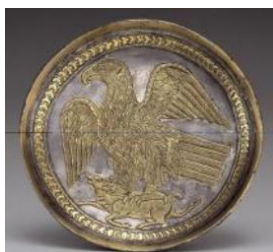
تصویر ۹. بشقاب نقره زراندود با نقش عقاب در حال شکار بزکوهی، (محمدپناه، ۱۳۸۷: ۱۹۵).

این ظرف تماماً به نقش عقاب اختصاص داده شده که در حال شکار بزکوهی است. هر دو این نقوش، از نمادهای خورشیدی محسوب می‌شوند: