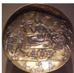
تصویر ۸. بشقاب نقره زراندود با نقش قلمزنی بزم شاهانه همراه با نقوش شیر و چرخ، (محمدپناه، ۱۳۸۷: ۱۹۰).

این ظرف تماماً به نقش عقاب اختصاص داده شده که در حال شکار بزکوهی است. هر دو این نقوش، از نمادهای خورشیدی محسوب می‌شوند: