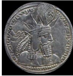
تصویر ۴. سکه بهرام اول با نقش پرتوهای خورشید، (شاهد، ۱۳۸۹: ۷۸).

در زمان بهرام دوم، چهره شاه بر روی سکه‌ها با نقش بال عقاب همراه شد: