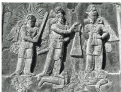
تصویر ۳. نقش برجسته تاجستانی اردشیر دوم از اهورامزدا و میترا؛ طاق بستان، (محمدپناه، ۱۳۸۷: ۱۷۷).

کاربرد نمادهای خورشیدی در نقش برجسته‌های دوره ساسانی، در مقایسه با دوره‌های اشکانی یا هخامنشی، کمتر شده و در موارد اندکی آن هم به صورت پرتو خورشید و یا در تاج پادشاهان به کاررفته است. برای نمونه در نقش برجسته تاجستانی اردشیر دوم از اهورامزدا و میترا، اردشیر دوم دیهیم پادشاهی را از اوهرمزد دریافت می‌کند و پشت او ایزد مهر با هاله و پرتوهای خورشیدی در اطراف سرش به نمایش درآمده است. همچنین او بر روی یک گل نیلوفر ایستاده که یکی از نمادهای خورشیدی محسوب می‌شود.