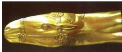
تصویر ۱۳. ریتون زرین به شکل سر اسب، (محمدپناه، ۱۳۸۷: ۱۹۶).