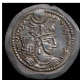
تصویر ۲۰. سکه یزدگرد دوم با نقش هلال ماه، (شاهد، ۱۳۸۹: ۸۵).