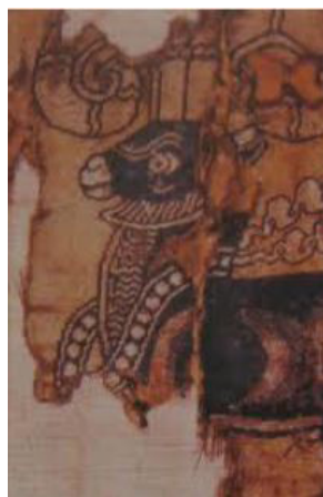
تصویر ۲۲. پارچه ساسانی با نقش قوچ، (گیرشمن، ۱۳۵۰: ۲۲۹).

در پارچه ساسانی متعلق به سده ۶-۷ میلادی، نقش قوچ توسط هنرمند بر روی پارچه بافته شده است: