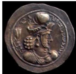
تصویر ۶. سکه بهرام چهارم با نقش بال عقاب، (شاهد، ۱۳۸۹: ۷۹).

در سکه نقره هرمزد دوم، باز هم از نقش بال عقاب استفاده شده است: