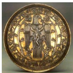
تصویر ۱۰. بشقاب زرین با نقش ایزدبانو آناهیتا و عقاب، (محمدپناه، ۱۳۸۷: ۱۹۰).

در اثر بعدی، نقش ایزدبانو آناهیتا که بر زمینه عقابی بزرگ نقش شده است: