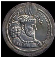
تصویر ۷. سکه هرمزد دوم با نقش بال عقاب، (شاهد، ۱۳۸۹: ۸۰).