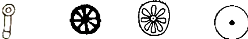
تصویر ۲. (گیرشمن، ۱۳۵۰: ۱۸۹).

رفته‌رفته عناصر دیگری به نمادهای خورشیدی افزوده شدند که پیچیده‌تر بوده و به این سادگی قابل تفسیر نمی‌باشند. از آن پس بشر کهن تنها به کپی آنچه از خورشید می‌دیده بسنده نکرده و تصاویر او تنها بر پایه درک بصری نبوده‌اند. یکی از رایج‌ترین شیوه‌های نشان‌دادن خورشید در هنر صخره‌ای، یک قرص کوچک با نقطه‌ای در میان آن بوده است. نقشی که پیداکردن ارتباط آن با خورشید حتی مشکل‌تر از این به نظر می‌رسد که قرصی است که یک گل هشت‌پر در میان آن قرار دارد. گاهی آن را به صورت چرخ پره‌دار نیز نشان می‌دادند. نکته جالب توجه این است که زمان این تقوش مربوط به چند هزار سال پیش از اختراع چرخ می‌باشد. از شیوه‌های دیگر نشان‌دادن خورشید افزودن جسمی ستونی شکل به زیر قرص مزبور بوده است (Encyclopedia iranica, 2013: 6-9).