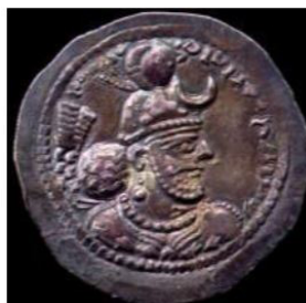
تصویر ۱۹. سکه یزدگرد اول با نقش هلال ماه، (شاهد، ۱۳۸۹: ۸۴).