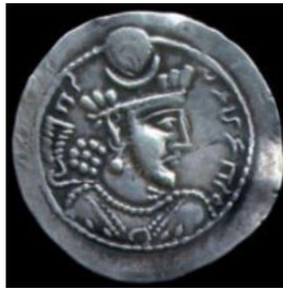
تصویر ۱۶. سکه بهرام پنجم با نقش هلال ماه، (شاهد، ۱۳۸۹: ۸۵).

همچنین سکه نقره جاماسب نیز با نقش هلال ماه تزیین شده است: