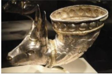
تصویر ۱۱. ریتون نقره با پایه‌ای به شکل سر بزکوهی، (محمدپناه، ۱۹۶: ۱۳۸۷).

ریتون بزکوهی و سر اسب، از جمله نمادهای خورشیدی دوره ساسانی به شمار می‌رود: