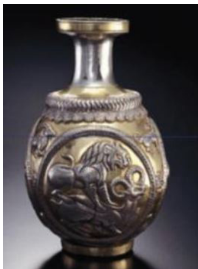
تصویر ۲۳. ظرف نقره زراندود با نقش شیر در حال شکار قوچ، (محمدپناه، ۱۳۸۷: ۱۹۹).

همچنین در آثار فلزکاری دوره ساسانی، ظروفی یافت می‌شود که دارای نقوش تلفیقی خورشیدی و مَهِی هستند که از جمله آن‌ها می‌توان به این ظرف اشاره کرد که صحنه شکار یک قوچ به دست شیر را به تصویر می‌کشد.