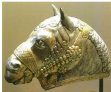
تصویر ۱۲. سر اسب از جنس نقره، (محمدپناه، ۱۳۸۷: ۱۹۶).