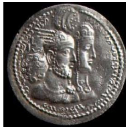
تصویر ۵. سکه بهرام دوم با نقش بال عقاب، (شاهد، ۱۳۸۹: ۷۹).

تصویر نیم‌تنه بهرام چهارم نیز نشانگر نقش بال عقاب، (از نشانه‌های خورشیدی) است که بر روی تاج نقش بسته شده است: