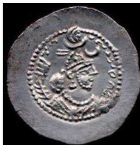
تصویر ۱۸. سکه پیروز اول با نقش هلال ماه، (شاهد، ۱۳۸۹: ۸۵).