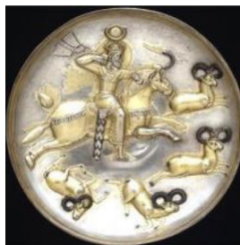
تصویر ۲۱. قاب فلزی با صحنه شکار پیروز اول با تاجی دارای هلال ماه و نقش قوچ، (شاهد، ۱۳۸۹: ۱۹۸).

در فلزکاری نیز نمادهای مَهِی در قالب نقش هلال ماه دیده می‌شود؛ هر چند در مواردی صحنه‌های شکار حیوانات مَهِی از جمله قوچ به‌کاررفته است. در این قاب فلزی پیروز اول در حال شکار گله قوچ، با تاجی با نقش هلال ماه است: