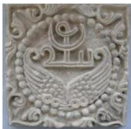
تصویر ۱۴. لوح گچی چهارگوش با نقش بال عقاب. (گیرشمن، ۱۳۵۰: ۱۸۹).