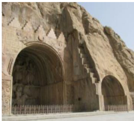
تصویر ۱۵. طاق بستان با نقش هلال ماه در بالای طاق بزرگ، (محمدپناه، ۱۳۸۷: ۱۷۶).

در طاق بستان، در بالای طاق بزرگ، نقش برجسته قرار دارد که نقش هلال ماه در آن حک شده است: