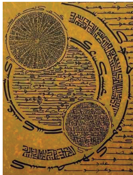
تصویر ۲. حسین زنده‌رودی، رودی، ۱۳۵۰، رنگ و روغن روی بوم، ۵۵ در ۷۷ سانتی‌متر، (URL 1 ).