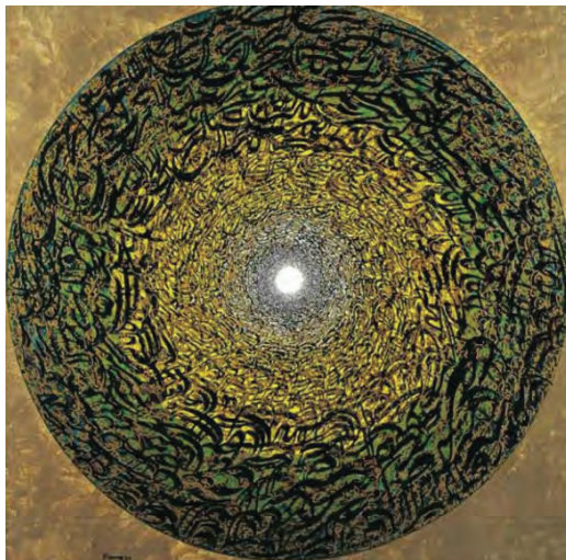
تصویر ۴. فرامرز پیلارام، معاصر، (URL ۴ )

اسطوره‌ای گشته که به شکلی فیگوراتیو و با فرمی یکپارچه، سودای رجوع به خویشتن را در قالب ملیت نمایان می‌کند.