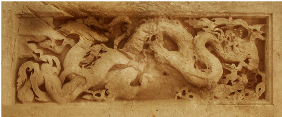
تصویر ۱۲. نقش اژدها، معبد داش کسن یا معبد اژدها، دامنه صخره‌های روستای وییر، سلطانیه، اواخر سده هفتم هجری، دوره ایلخانی.

با انقراض حکومت‌های سلجوقیان و سپس خوارزمشاهیان در ایران و با استقرار و حکمرانی مغولان در دو سرزمین ایران و چین ارتباط فرهنگی بسیار نزدیکی بین این دو کشور برقرار می‌شود. تأثیر نقش اژدهای چینی در هنر ایران در دوره ایلخانان مغول بسیار چشمگیر و قابل پیگیری است. نقش اژدها در تزیینات هنرهای کاربردی و تزیینات وابسته به معماری به فراوانی دیده می‌شود. نقش اژدها در معبد تاریخی داش کسن یا معبد اژدها از ویژگی خاصی برخوردار است. این معبد از سمت شمال به دشت سلطانیه و بنای تاریخی آرامگاه سلطان محمد خدابنده اشراف دارد. این معبد در دامنه صخره‌های روستای وییر کنار شهر قدیم سلطانیه قرار دارد. شکل‌گیری این معبد پس از مرگ ارغونشاه، (۶۹۰-۶۸۳ هجری) با پشتکار الجای خاتون، خواهر سلطان الجایتو محمد خدابنده (۷۱۶-۷۰۳ هجری) آغاز شد، ولی به پایان نرسید. در این معبد نقوشی از هنر چینی به کار رفته است. نقش‌های اژدها به طول ۵ متر و عرض ۱/۵ متر در زمره بزرگ‌ترین نقوش تزئینی این معبد است (شکل ۱۲). تأثیر و تأثر متقابل ایران و چین بر یکدیگر بیش از هر محل دیگری در این مکان مشهود است چنانچه تلفیق طرح‌های اسلیمی و نقش اژدها این موضوع را متذکر می‌شود.