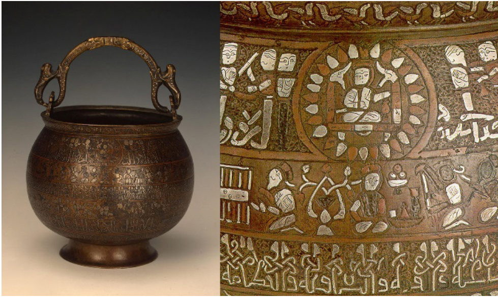
تصویر ۵. دیگ معروف به بپرینسکی، هرات، دوره سلجوقیان، سال ۵۵۹ هجری، سن پیترزبورگ، موزه ارمیتاژ.

جوزهر در شمایل‌نگاری‌های هندو و اسلامی به صورت شبه سیاره‌ای است که مسئول کسوف و خسوف ماه است. او از خدای هندو، راهو، سرچشمه گرفته است که ویژگی او سر بریده اژدها است. از این رو، در طالع‌بینی اسلامی، او با سر اژدهایی که بر روی عصایی در دو طرف قرار گرفته است، به تصویر کشیده شده است. راهو برخلاف میل خدایان، جرعه‌ای از نوشیدنی جاودانگی، امریتا را نوشیده بود. ویشنو که توسط خورشید و ماه محکوم شده بود، سر او را از تنش جدا کرد؛ اما اکنون جاودانه، سر و بدن او باقی مانده بود تا از خورشید و ماه انتقام بگیرد. هر زمان که می‌توانستند، دو بخش راهو تلاش می‌کردند خورشید و ماه را ببلعند و از این طریق به ترتیب باعث کسوف و خسوف شوند (Hartner, 1973, 121).