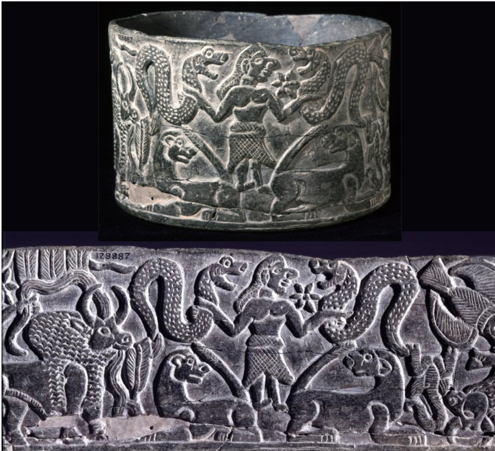
تصویر ۱. نقش پیکره یک موجود خارق العاده (جوزهر)، ظرف سنگی (سنگ صابون)، هزاره پنجم قبل از میلاد، جیرفت، لندن، موزه بریتانیا.

شبيه اين نقش در مفرق‌های لرستان حدود، ۶۰۰ سال قبل از میلاد، هم به شکل بسیار متنوعی قابل ردیابی است (شکل‌های ۲ و ۳).