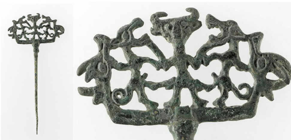
تصویر ۲. نقش جوزهر، سنجاق سر، مفرق‌های لرستان حدود، ۶۰۰ سال قبل از میلاد، پاریس، موزه لوور.

شبيه اين نقش در مفرق‌های لرستان حدود، ۶۰۰ سال قبل از میلاد، هم به شکل بسیار متنوعی قابل ردیابی است (شکل‌های ۲ و ۳).