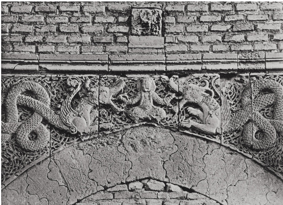
تصویر ۹. نقش اژدها، دروازه طلسم بغداد، ۶۱۸ هجری، خلیفه عباسی الناصر (۶۲۲-۵۷۶ هجری).

نقش اژدها در هنر سلجوقیان در قرن ششم و هفتم هجری کاملاً رایج است. مشهورترین نمونه از ارتباط نقوش اژدهای با اهمیت طلسمی در دروازه طلسم بغداد است که در سال ۶۱۸ هجری احتمالاً می‌بایستی به پیشنهاد منجمان و به دستور خلیفه عباسی الناصر (۶۲۲-۵۷۶ هجری) ساخته شده باشد. در این نقش سنگی، یک پیکره انسانی بین دو اژدها نشسته و اژدهایی که به سمت سر انسان چرخیده شده را نگه داشته است. هر کدام از دو اژدها بال دارند و با یک جفت شاخ و دو پای جلویی به تصویر کشیده شده‌اند. (تصویر ۴:۲۹).