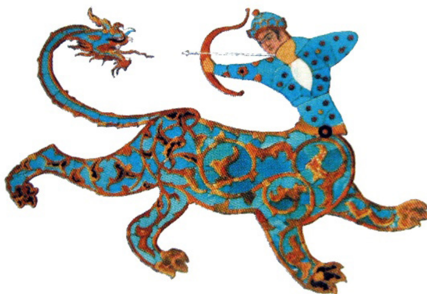
تصویر ۶. صورت برج قوص، کاشیکاری، سردر بازار قیصریه اصفهان، دوره صفویه.