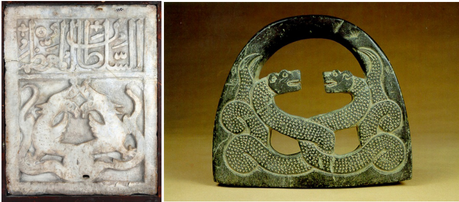
تصویر ۷. دو مار به همدیگر گره خورده، شیخ سنگی آیینی، هزاره پنجم قبل از میلاد، جیرفت، تصویر ۸. دو مار به همدیگر گره خورده، پلاک سنگی مرمر، اواخر سده هشتم و یا اوایل سده نهم هجری، احتمالاً آتاتولی، قاهره، مجموعه ذوالمویدالدین سیف‌الدین شیخ.

نقش اژدها در هنر سلجوقیان در قرن ششم و هفتم هجری کاملاً رایج است. مشهورترین نمونه از ارتباط نقوش اژدهای با اهمیت طلسمی در دروازه طلسم بغداد است که در سال ۶۱۸ هجری احتمالاً می‌بایستی به پیشنهاد منجمان و به دستور خلیفه عباسی الناصر (۶۲۲-۵۷۶ هجری) ساخته شده باشد. در این نقش سنگی، یک پیکره انسانی بین دو اژدها نشسته و اژدهایی که به سمت سر انسان چرخیده شده را نگه داشته است. هر کدام از دو اژدها بال دارند و با یک جفت شاخ و دو پای جلویی به تصویر کشیده شده‌اند. (تصویر ۴:۲۹).