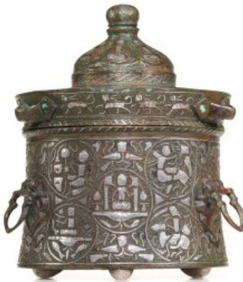
تصویر ۴. مرکبدان مفرغی، احتمالاً هرات، دوره سلجوقیان، حدود ۶۰۰ هجری، Sothebys.com

تصویر جوزهر بر تخت نشسته در میان یک جفت عصا با سر اژدها در شمار زیادی از ظروف فلزی دوره سلجوقی از جمله در تزیینات دیگ معروف به ببرینسکی، سال ۵۵۹ هجری، در موزه ارمیتاژ دیده می‌شود (شکل ۵).