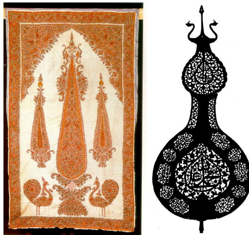
تصویر ۱۳. علم، دوره صفویه، سده ۱۲ هجری، مجموعه دیوید، کپنهاگ. تصویر ۱۴. پرده قلمکار، دوره قاجار، سده ۱۳ هجری، موزه برلین.

نگارنده در یادداشتی با عنوان: صورت معنوی هنر عاشورایی، در کتاب دومین سوگواره پوستره‌های عاشورایی، موضوع را با مفهوم درخت زندگی همسودانسته: «شکل بسیاری از علامت‌ها و سر علم‌ها که با تیغه‌های فلزی به صورت نقش تجریدی درخت سرو (سرو سر خمیده) که در دو طرف آن نقش طاووس قرار گرفته ساخته شده است که از لابلای آن سرهای اژدها بیرون آمده است (شکل ۱) / در اینجا شکل‌های ۱۳ و ۱۴. در هنر ایران «درخت زندگی» همراه با نقش طاووس جایگاه مهمی دارد. به اعتقاد پیشینیان طاووس نابودکننده مار (اژدها) و مار نماد اهریمن که درصدد تسلط بر درخت زندگی است (گرتروود. ۱۳۷۰: ۵۶). با سلطه مار بر درخت زندگی سبب خشک‌سالی و آب در روی زمین به آفت شوری و بدمزگی آمیخته می‌شود (میرچیا، ۱۳۶۵: ۱۳). هنرمند با ذوق عاشورایی به شکلی نمادین، از خمیرمایع «درخت زندگی» بافرمی نودر جهت معنا دادن به فاجعه کربلا سود جسته‌اند. شاید در اینجا حضور اژدها بر فراز این درختان تجریدی همانا سلطه یزیدیان بر شجره طیبه ولایت و از طرفی دیگر یادآور عطش و تشنگی و قطع آب روز عاشورا است» (خرزائی، ۱۳۸۸: ۱۴-۱۶).