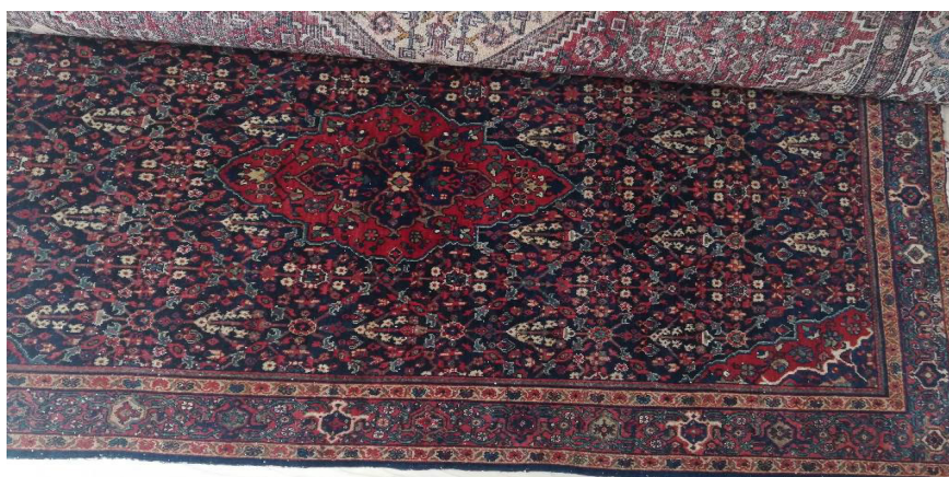
تصویر ۵. فرش با نقش گل حنا با ترنج و لچک، بازار اراک، (منبع نگارندگان)

نقشه فرش گل حنا (تصویر ۵-۵) تجلی تصویری از بهشت و زیبایی در منطقه‌ای خشک و کویری است؛ فضایی آرمانی که در آن، طبیعت سرسبز و زاینده جایگزین کم‌آبی و خشکی زیست‌بوم واقعی می‌شود. الهام‌بخش این نقشه، گل حنا است؛ گیاهی که با وجود محدودیت منابع آبی، از زیبایی بصری، خواص درمانی و ارزش اقتصادی برخوردار بوده و در زندگی روزمره ساکنان منطقه نقشی حیاتی ایفا کرده است. رویش این گل می‌تواند نویدبخش بهار، تداوم حیات و احیای زمین تلقی شود و تکرار منظم نقش آن در متن فرش، تلاشی نمادین برای بازآفرینی سرسبزی و نظم قدسی در یک مکان معناپرداخته است. در این چارچوب، حضور عناصر ساختاری چون تقارن، تکرار، نقش‌های چهارگانه و نمادهای خورشیدی از جمله چلیپا می‌تواند یادآور نوعی نظم کیهانی و جهان‌بینی خورشیدمحور در سنت‌های کهن ایرانی باشد. باین حال، نسبت دادن مستقیم این مؤلفه‌ها به آیین مهر نیازمند شواهد تاریخی، باستان‌شناختی و تطبیقی دقیق‌تری است؛ از این رو، در این پژوهش، این همخوانی صرفاً در سطح نشانه‌شناختی و اسطوره‌ای و در پیوند با مفاهیم عام قداست، آفرینش و باززایی مورد توجه قرار می‌گیرد.