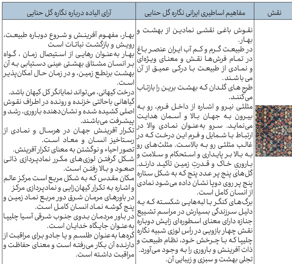
جدول ۱. تطبیق نگاره گل حنا در فرش اراک با آرای الیاده

درباره «درخت کیهانی» و «محور عالم» قابل تفسیر است؛ نمادهایی که پیوند زمین و آسمان، مرگ و رستاخیز، و انسان و امر قدسی را برقرار می‌کنند. نقش گل حنا، با بازنمایی سرسبزی و زایش در بستر اقلیمی خشک و کویری، بیانگر تمایل انسان به رهایی از زمان خطی و دستیابی به نوعی بهشت زمینی و ملموس است؛ همان حسرت ازلی که یاده آن را یکی از بنیان‌های شکل‌گیری اسطوره و آیین می‌داند. درنهایت، این پژوهش نشان می‌دهد که نقش گل حنا در فرش اراک را می‌توان به عنوان متنی بصری و آیینی خوانش کرد که از طریق زبان نمادین طبیعت و هندسه، مفاهیم بنیادین اسطوره‌ای چون آفرینش، قداست، باززایی و نظم کیهانی را بازتولید می‌کند. چنین خوانشی، ضمن تأکید بر غنای معنایی فرش‌های ایرانی، اهمیت به‌کارگیری چارچوب‌های نظری اسطوره‌شناختی به‌ویژه آرای میرچا الیاده را در فهم عمیق‌تر هنرهای سنتی ایران آشکار می‌سازد و زمینه‌ای برای بازشناسی و احیای نقوش فراموش‌شده‌ای چون گل حنا فراهم می‌آورد. در انتها به منظور درک بهتر معنای این نقش جدولی تطبیقی ارائه شده است (جدول-۱).