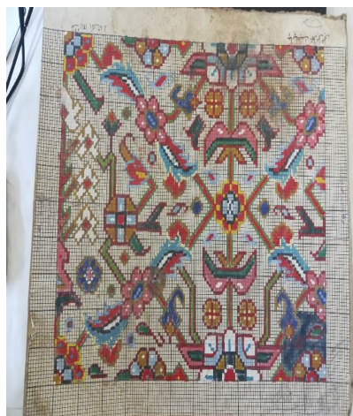
تصویر ۴. چهاربازو در لوزی‌های احاطه‌کننده گل حنا

از منظر ساختار کلی نقشه، قرارگیری درختچه‌های گل حنا درون لوزی‌های انتزاعی و شبکه‌های لوزی‌گون، امکان خوانش دیگری را نیز فراهم می‌کند. لوزی می‌تواند به عنوان صورتی از «زمین / جهان» و نیز نشانه‌ای از نظم و هماهنگی تفسیر شود، به ویژه هنگامی که مربع برگوشه قرار می‌گیرد و به پویایی و کمال دلالت می‌کند (افروغ، ۱۳۹۳: ۲۴). همچنین نقش‌های چهاربازویی و چلیپا در رأس برخی لوزی‌ها، در سنت‌های کهن، با مفاهیم خورشید، عناصر چهارگانه و نظام طبیعت پیوند یافته‌اند و نمونه‌های تاریخی آن در هنر ایران باستان گزارش شده است (تصویر ۴) (آموزگار، ۱۳۸۸: ۲۳).